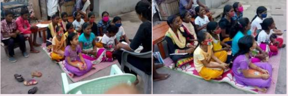
CRM children discussing about the webinar on National Education Policy (NEP) and also meeting is headed by CRM children