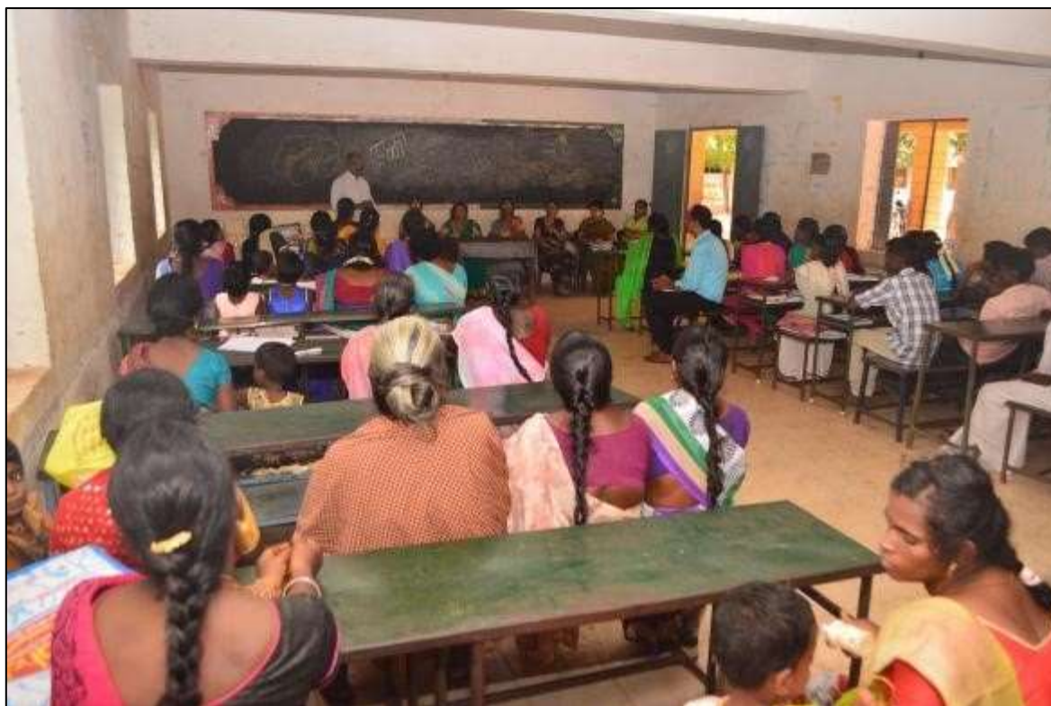
Health and Nutrition training to People Living with HIV/AIDS