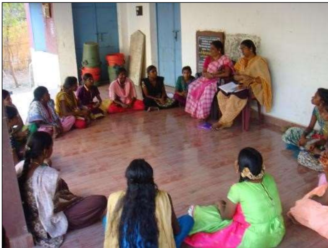
Body Mapping and Hygiene to Children and Adolescent Girls