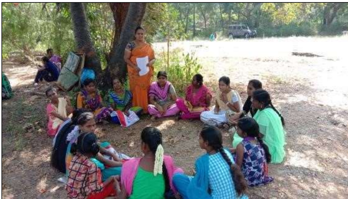
Educational guidance and motivation to Adolescent Girls