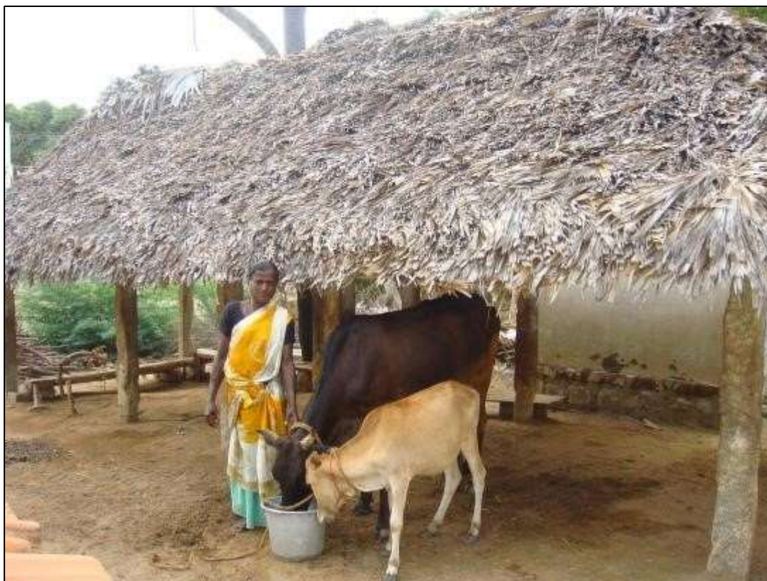
Cow rearing as an Income Generation Activities for the Beneficiaries