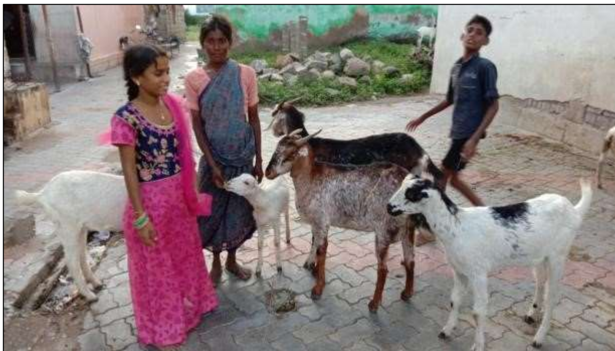
Goat rearing as an Income Generation Activities for the Target Population