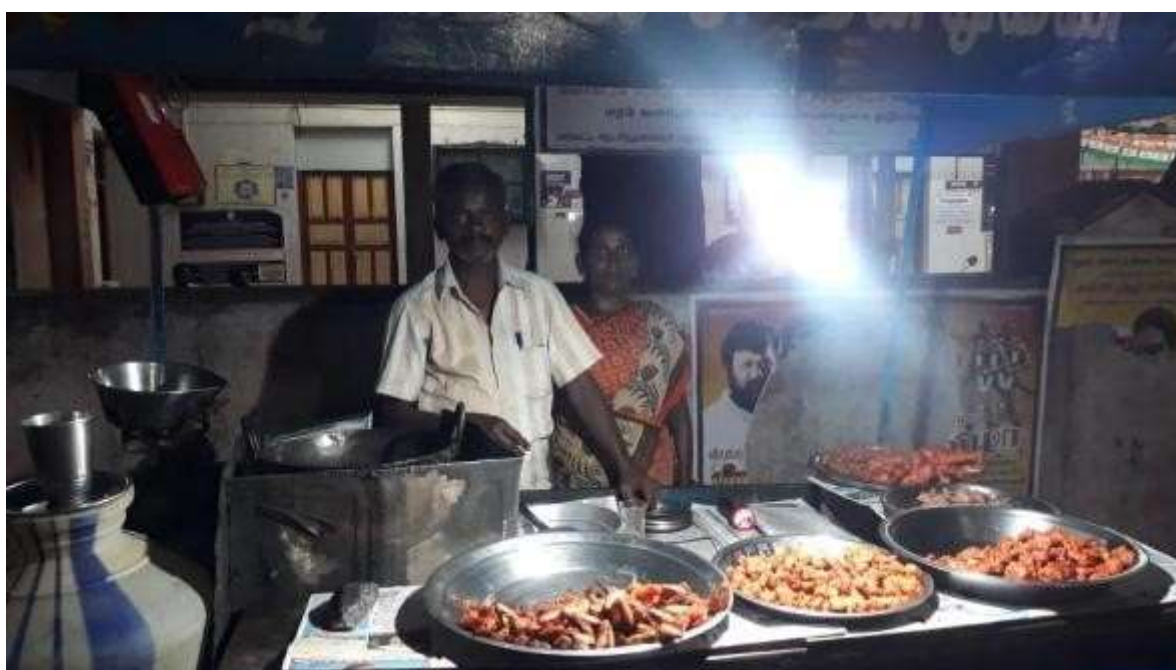
Small Tiffin centre for the infected people as a livelihood option