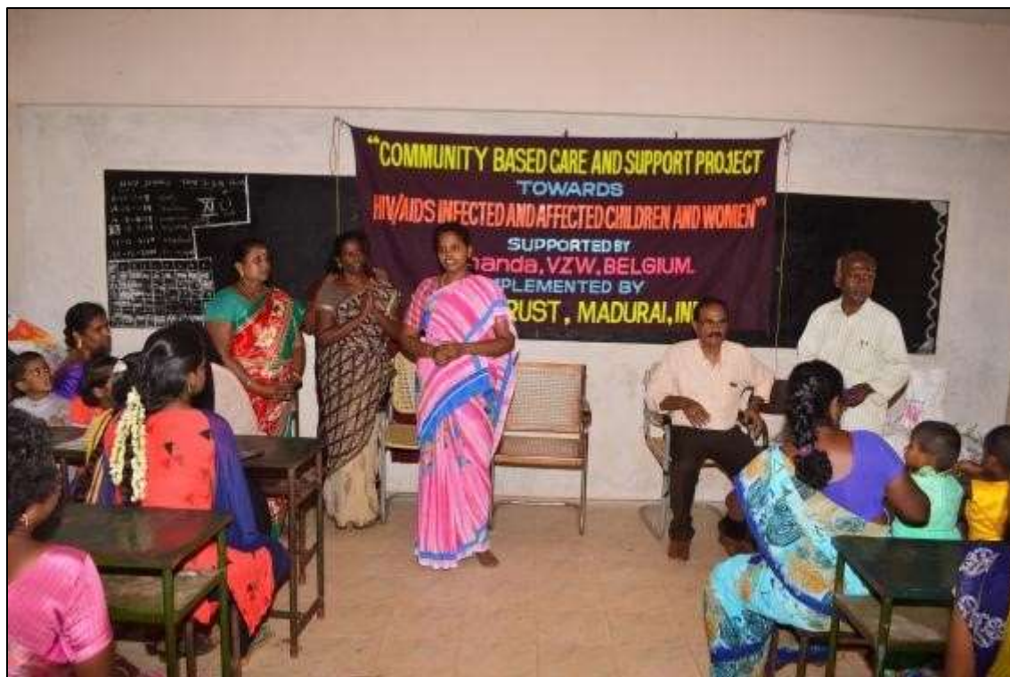
Sensitization to Local Body Leaders by our Project Team